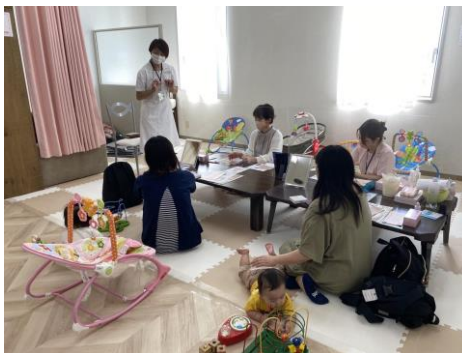
スポンサー様主催講座