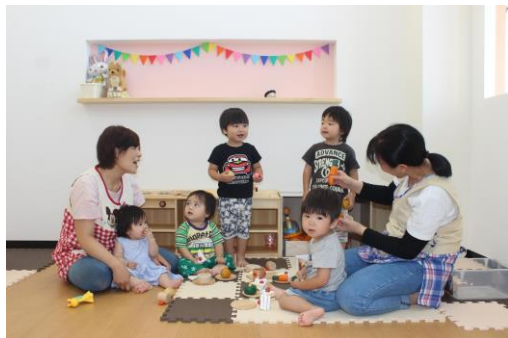
チェリッシュ保育園