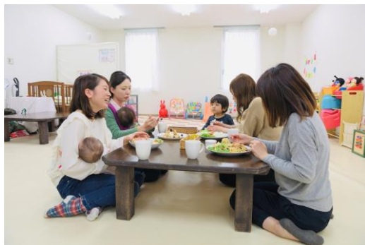
チェリッシュカフェ